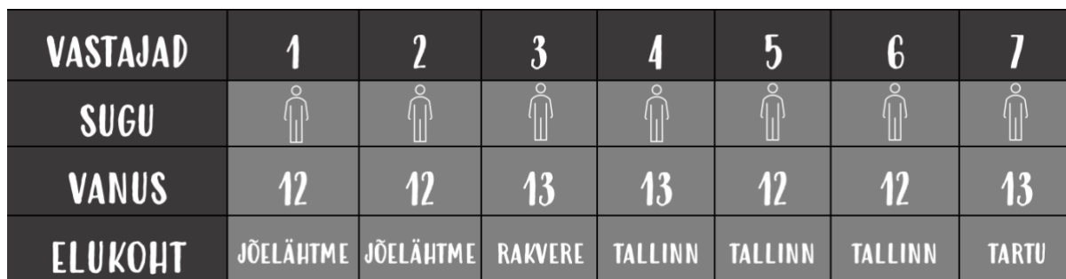
Tabel 1. Info vastajate kohta.

laste puhul on oluline ka vanema nõusoleku saamine intervjuu jaoks (vt LISA C), mille koostas ja edastas enne intervjuude toimumist läbi oma kontaktide lapsevanematele. Koos nõusoleku ankeediga saatsin kõigile oma kontaktidele ka kirjaliku pöördumise (vt LISA D), milles lapsevanem ja intervjueeritav said tutvuda minu lõputöö teemaga. Kui nad olid mõlemat lugenud, saatis lapsevanem ankeedi mulle digitaalselt allkirjastatuna tagasi e-kirja teel. Nõusolek kinnitab vabatahtliku osalemise nii noormehe poolt kui ka vanema